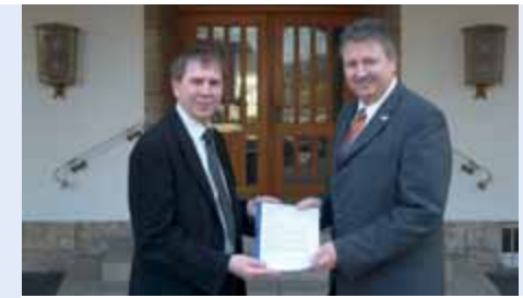
Übergabe von 446 gesammelten Unterschriften von der Bürgerinitiative „Sendermast am Rennufer“