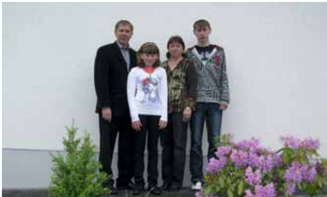
Die Familie Wecker