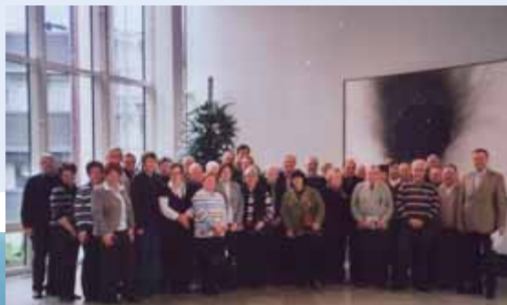
Besuch des Landtags NRW

Ich bin Mitglied in vielen Vereinen in unserem Dorf, unter anderem war ich 28 Jahre Presbyter in der evangelischen Kirchengemeinde und in der Zeit war das ökumenische Zusammenleben für mich eine Herzensangelegenheit.